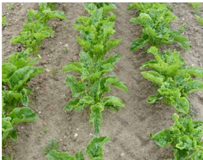
Behandling med Bio pH Control (til venstre) og uden Bio pH Control (til højre). Begge er behandlet efter 3 timers forsinket udbringelse. Der er lavet 3 behandlinger med ca. 7 dages interval.

Bio pH Control har i forsøgene hævet effekten af de anvendte herbicider med 12,5 %, og ved en forsinkelse i udbringning med 3 timer er effektstigningen, ved at pH-sænke med Bio pH Control, hævet med helt op til 66,6 %.